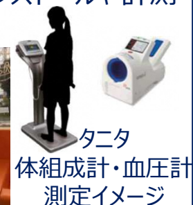
タニタ 体組成計・血圧計 測定イメージ