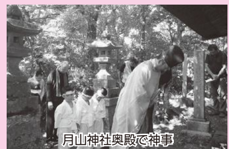
月山神社奥殿で神事