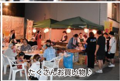
たくさんお買い物♪