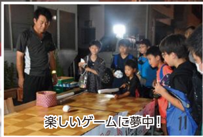
楽しいゲームに夢中!

8月5・6日の2日間「さんのへ夏まつり」が開催されました。歩行者天国では、沿道に立ち並び露店のほか「11ぴきのねこ仮装大賞」やさまざまなイベントが行われ、多くの人たちでにぎわいました。