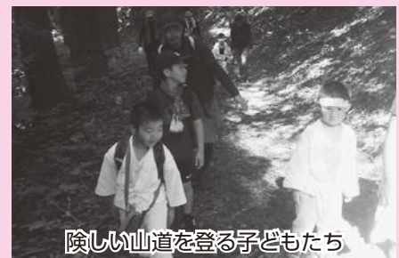
険しい山道を登る子どもたち

白装束に身を包んだ男児たちは、男性の保護者とともに出発。途中、岩場を這うように登る難所も乗り越え、登頂を果たしました。山頂の月山神社奥殿では、神事を行い、絵馬を納め健やかな成長を祈りました。