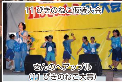
さんのへアップル (11ぴきのねこ大賞)