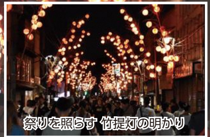
祭りを照らす 竹提灯の明かり