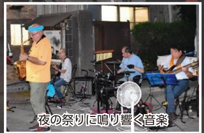
夜の祭りに鳴り響く音楽