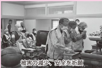
被害の減少、安全を祈願