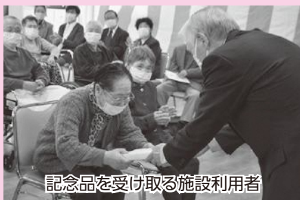
記念品を受け取る施設利用者