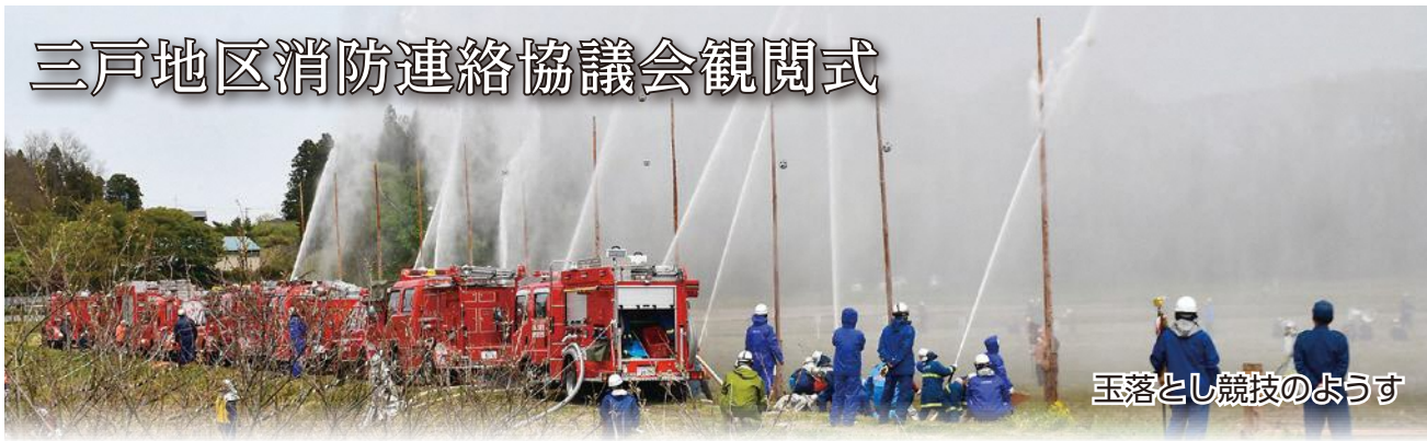
玉落とし競技のようす

4月29日、三戸地区消防連絡協議会観閲式が南部町を会場に行われ、三戸町、田子町、南部町の3町の消防団員約700人が参加しました。南部町ふるさと運動公園（駐車場）で行われた式典では、まとい振りやはしご乗りのほかに、ポンプ操法訓練や中継送水競技などが行われ、息の合った動きで日頃の訓練の成果を発揮しました。式典後に行われた玉落とし競技では、三戸町消防団第9分団が小型ポンプの部で、第2、6、19分団が自動車ポンプの部で、合計4つの分団が見事第1位に輝きました（第9、19分団は、昨年に引き続き2連続で第1位）。