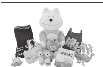
2位：11ぴきのねこグッズ（12.0%）