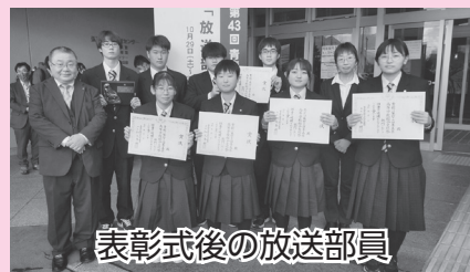
表彰式後の放送部員