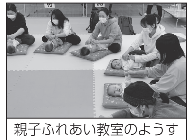
親子ふれあい教室の様子

電話での相談は随時、受け付けています。来所での相談日は、広報に掲載している行事予定表のとおりです。