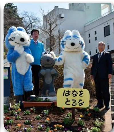
ふくじゅそうでの除幕式の様子