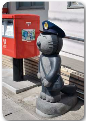
三戸郵便局の「郵便局員ねこ」