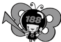
消費者庁 消費者ホットライン 188 イメージキャラクター「イヤヤン」

そんなときは一人で悩まずに、全国どこからでも3桁の電話番号でつながる消費者ホットライン「188(いやや!)」にご相談ください。専門の相談員がトラブル解決を支援します。