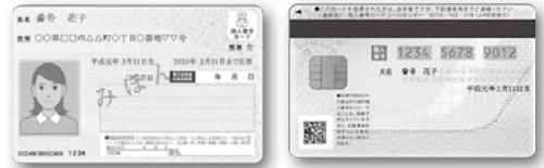
マイナンバーカード（見本）