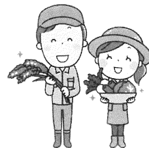
農地を 借りたい人