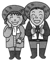
農地を 貸したい人

農地中間管理事業とは県指定の「農地中間管理機構」が農地の中間的受け皿となり、農地を借り入れ、規模拡大を目指す担い手に貸し付ける事業です。