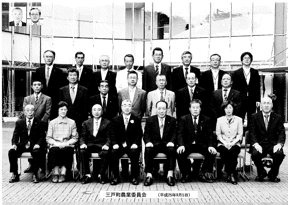
三戸町農業委員会 (平成25年9月5日)